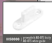
III50000 | przewodnik A0-075 biały A0-075 white guide