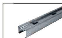
profil bazowy górny GUSTAVSON upper basic profile GUSTAVSON